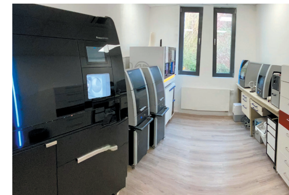
Mit innovativen, leistungsstarken Digitaltechnologien sind wir in der Lage, zahlreiche Versorgungsarten und prothetische Sonderprodukte für Sie und Ihre Patienten zu fertigen.

In Verbindung mit Teleskop-Primärkronen aus Zirkonoxid können wir jetzt auch Teleskop-Versorgungen komplett ohne Metall fertigen. 2021 können wir auf viele erfolgreiche Versorgungen dieser Art zurückblicken.