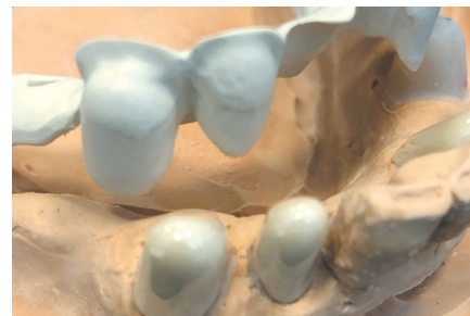
Metallfreie UK-Teleskopversorgung, Primärteile aus Zirkonoxid, Sekundärkonstruktion aus Utaire®.