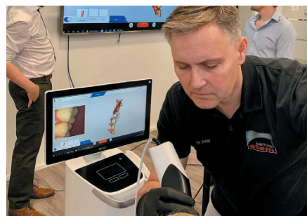
Stein Zahntechnik begleitet Ihre Praxis und Ihr Praxislabor auf dem Weg in die digitale Zukunft.