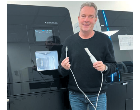
Stein Zahntechnik begleitet Ihre Praxis und Ihr Praxislabor auf dem Weg in die digitale Zukunft.

Gerne können Sie eine große Auswahl Intraoral-Scanner in Ihrer Praxis kostenfrei testen. Inklusive umfassender Demo. Auf Wunsch mit Intraoral-Scan an einem Ihrer Patienten.