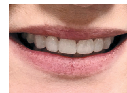
Der sichere Weg zu Wunschzähnen. Mit unserem M-Smile-Verfahren für die Ästhetikplanung und einem Mockup als „Zahnersatz zur Probe“. Abb.: Patientenfall von Stein Zahntechnik.