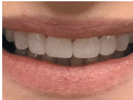
Beispiel Frontzahnersatz: Das eingesetzte Mockup als vorweg genommenes zukünftiges Ergebnis. Der Patient kann Änderungswünsche äußern, noch vor der Behandlung.

Bei der digitalen Zahnaufstellung werden Positionierung, Form, Länge und Farbe der Zähne wunschgerecht gestaltet. Die Visualisierung der endgültigen Versorgung, bereits vor der Herstellung der neuen Zähne, begeistert Patienten. Die Visualisierung erhalten Sie von uns für Ihre Patientenberatung und als Basis für die Erstellung eines Mockups, falls Ihr Patient dies wünscht.