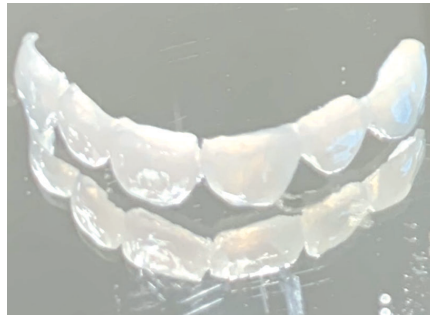
Das fertige Mockup aus Kunststoff. Es besitzt das Aussehen, die Maße und Eigenschaften, die zuvor vom Patienten und Zahnarzt festgelegt wurden. Mit einem Mockup kann sich der Patient ein Gesamtbild von seinem zukünftigen Zahnersatz machen: Optik, Ästhetik, Mundgefühl und Tragekomfort.

Wichtigkeit von Patientenfotos Für die optimale Ästhetik-Planung sollten aktuelle Fotos vom Mund- und Lippenbild des Patienten erstellt werden, z. B. mit einem I-Pad oder Smartphone. Die Fotos werden in unsere Design-Software importiert. Die Bild-daten sind ein wichtiger Faktor für die wunschgerechte Zahnersatzkonstruktion. Durch die Hinzuziehung von Patientenfotos bei der ästhetischen Planung erhöht sich erfahrungsgemäß auch die Zufriedenheit und Akzeptanz der Patienten mit den Ergebnissen.