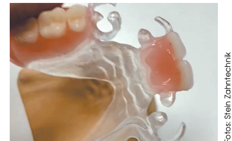
Beliebte Übergangsvorsorgung: Ästhetische Provisorien und Interims-Zahnersatz ohne Metallklammern.